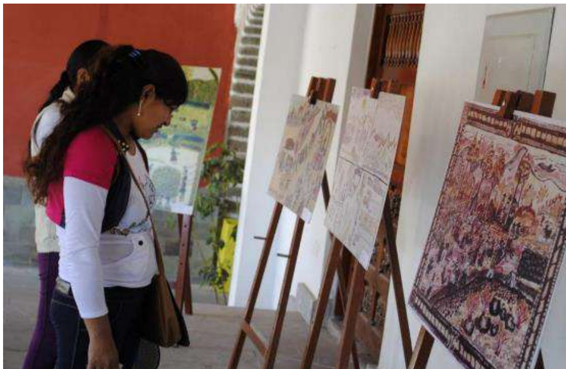
Exposición de la Muestra de Pintura Campesina en los ambientes de la Municipalidad Provincial de Huamanga, Ayacucho. Agosto de 2015