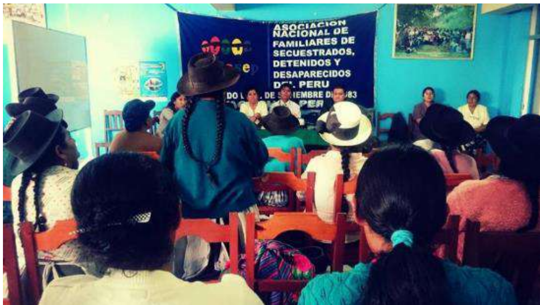
Taller informativo realizado con integrantes de ANFASEP y miembros del Ministerio Público. Noviembre de 2015