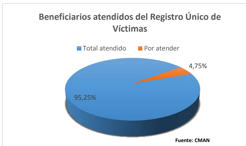
Gráfico N° 4

Elaboración: Secretaría Técnica de la CMAN