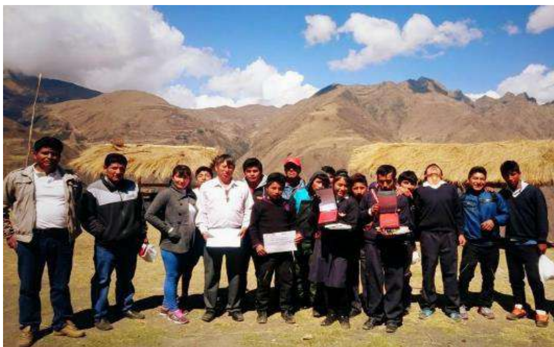
Ceremonia de premiación de escolares ganadores del concurso de historietas en la comunidad de Qotopuquio, distrito de Chungui, región Ayacucho. 21 de setiembre de 2015